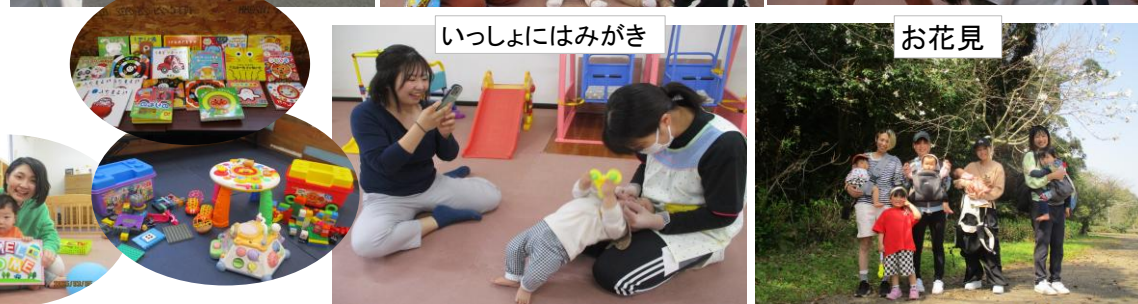
いっしょにはみがき