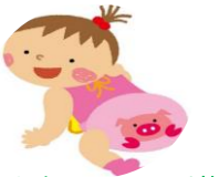
ハイハイよちよち選手権